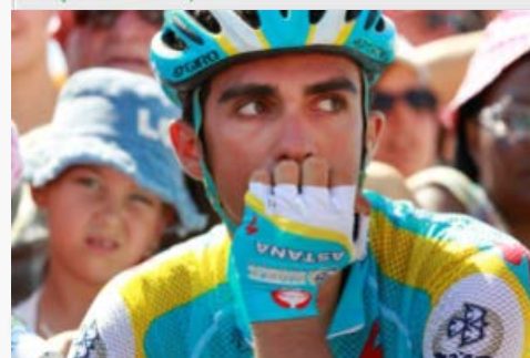
Doping. I consigli di Lance Armstrong a Alberto Contador