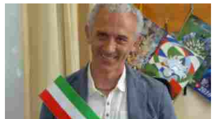
LATINA, VERRÀ NOMINATA LA GIUNTA