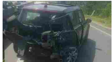
35ENNE DI TERRACINA DENUNCIATO